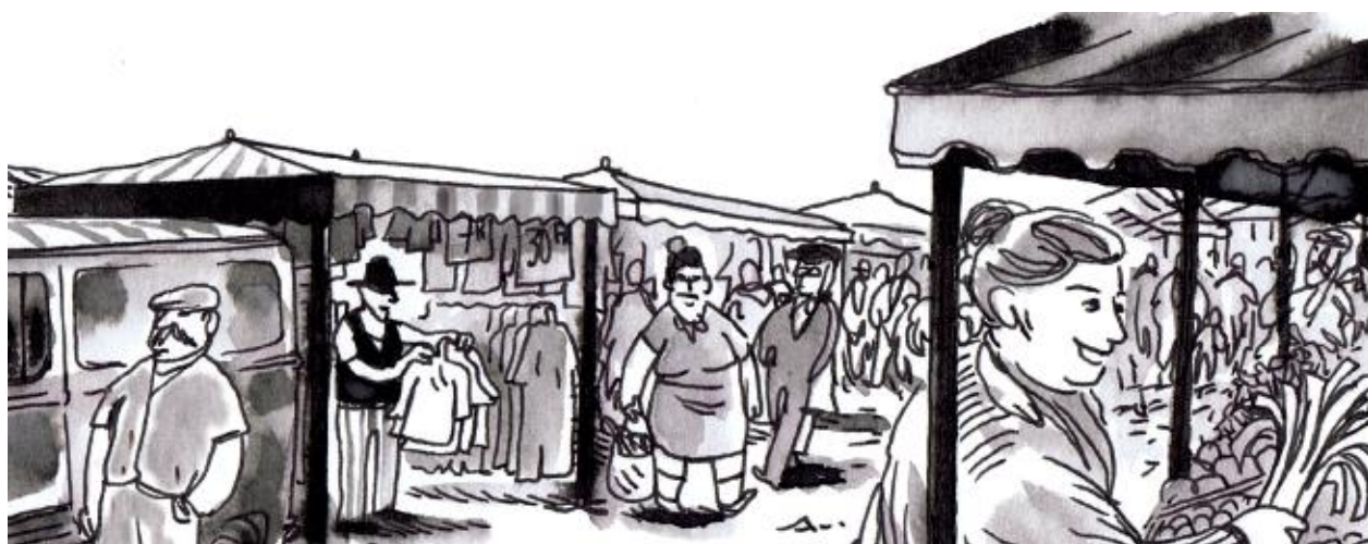
Illustration de Julien Revenu - Bande dessinée "Les gens du lieu", ADGVE, 2014, éditée par la DIHAL